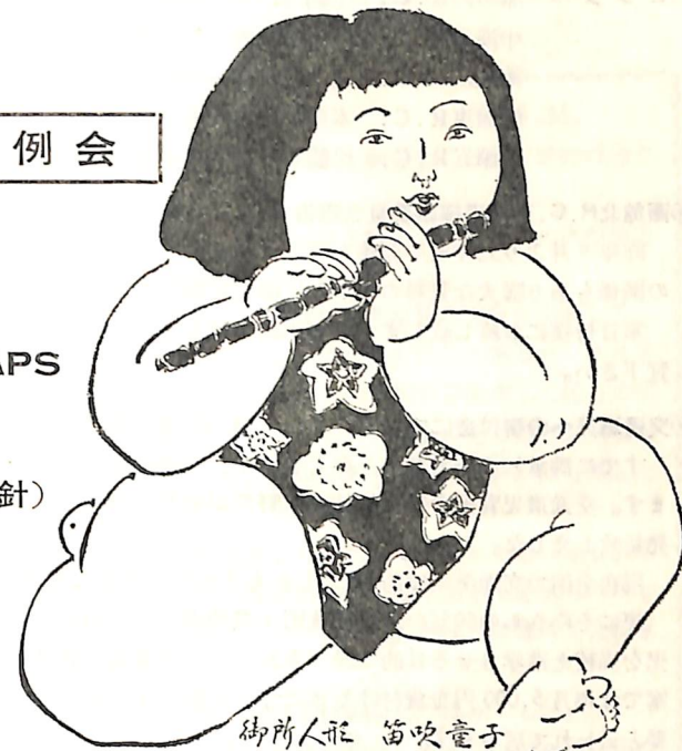
御所人形 笛吹童子