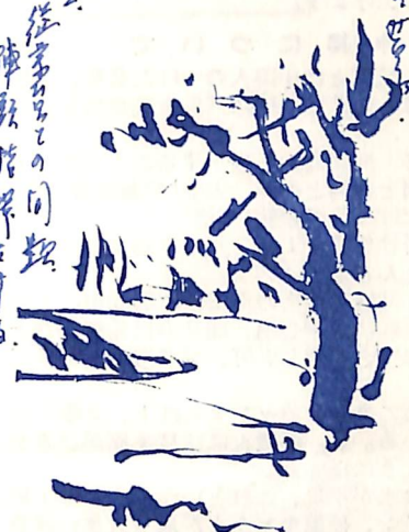
深瀬 鴻一郎 会員