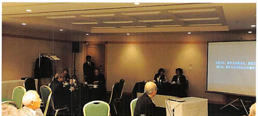
小笠原会員も元気に例会へ出席していました。