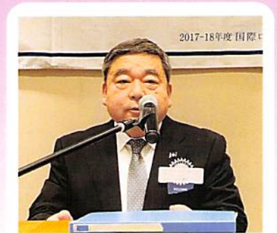
1月31日 卓話 函館海上保安部長 奥原 徳男 氏