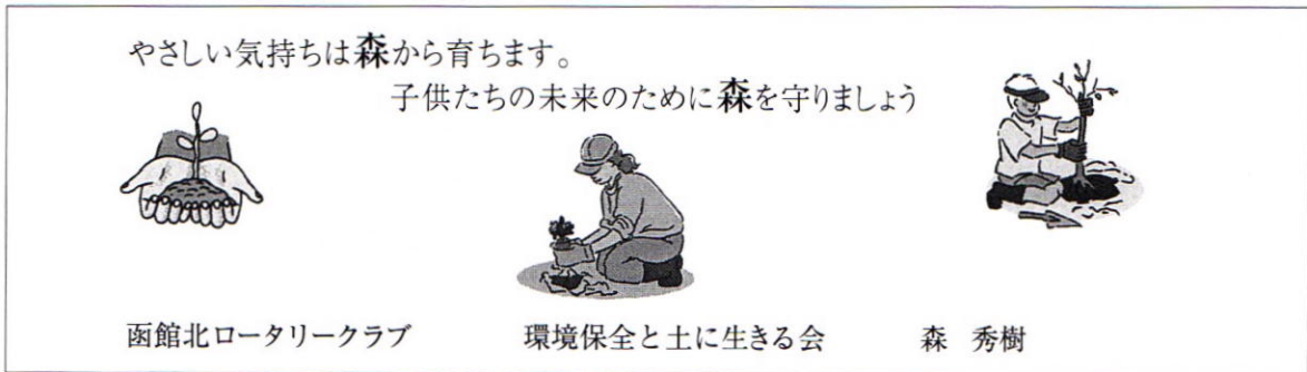
(広告掲載：森 秀樹 会員)