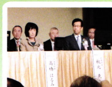
10月1～2日地区大会報告

夜間例会 午後6時30分～ クラブアッセンブリー 例会終了後～ 於 フォーポイントバイシェラトン函館