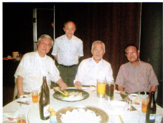
(会報担当者：増田 定雄 委員長)