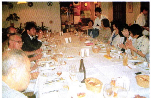
(会報担当者：増田 定雄 委員長)