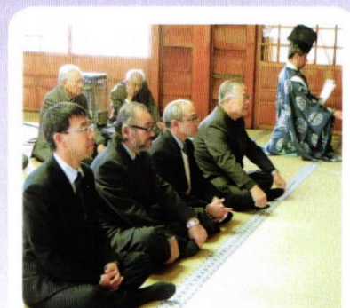
1月27日 節分例会 於 亀田八幡宮