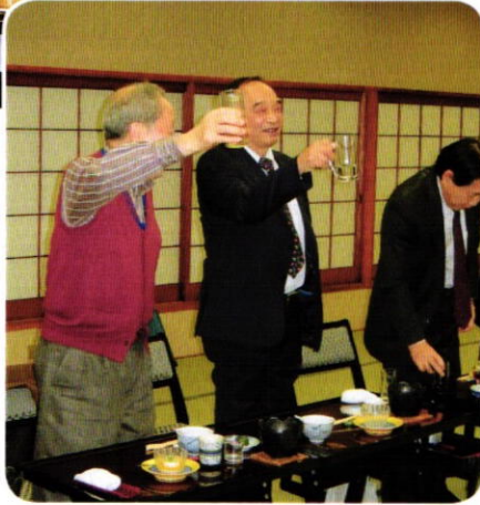
メの乾杯 吉田エレクト