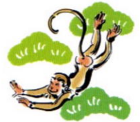
(会報担当者：森 秀樹 委員)