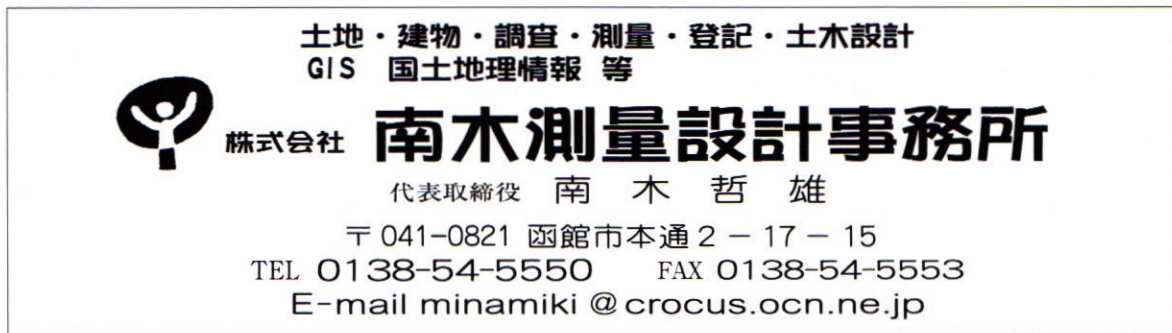
(広告掲載：南木 哲雄 会員)