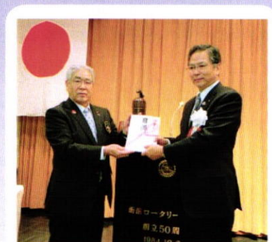
11月28日 合同例会・I M