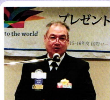
11月4日 卓話 海上自衛隊函館基地隊司令 一等海佐 尾島 義貴 氏