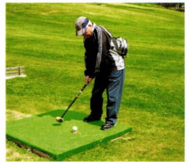
5月17日 移動例会・家族会 於 グリーンピア大沼

2014~2015 <第2474回例会> 第40号 5月17日の記録 (5月20日(水)の移動です)