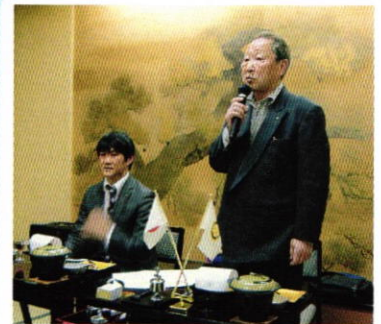
1月7日 新年恒例会 於 一乃松