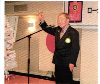
12月24日 クリスマス家族会