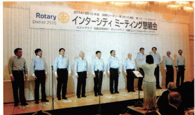
(会報担当者：渡部 二康 委員長)