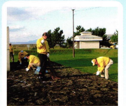
9月17日 早朝例会 洞爺丸慰霊碑清掃