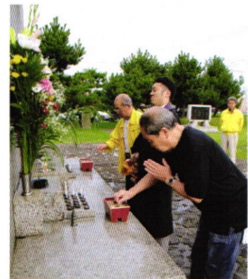
9月11日 早朝例会 洞爺丸慰霊碑清掃