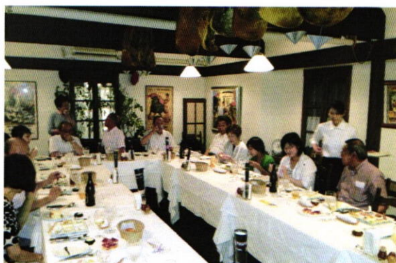
本日も美味しい料理、お酒をいただきました。 パンがとても美味しかったです。