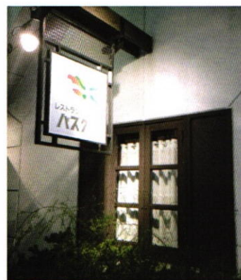
8月21日 夜間家族会 レストラン バスク