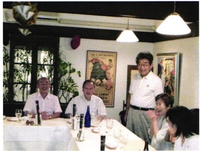
南木会員 メの挨拶