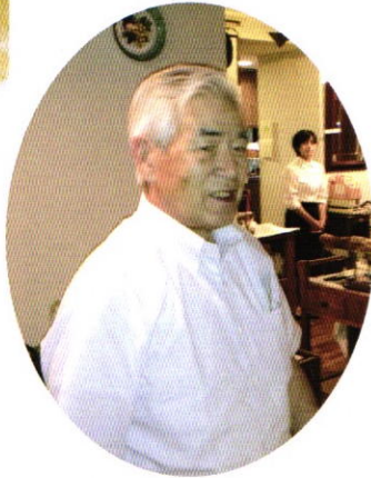
松見親睦委員長 ご苦労さまでした