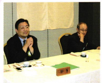
6月19日 各理事退任挨拶