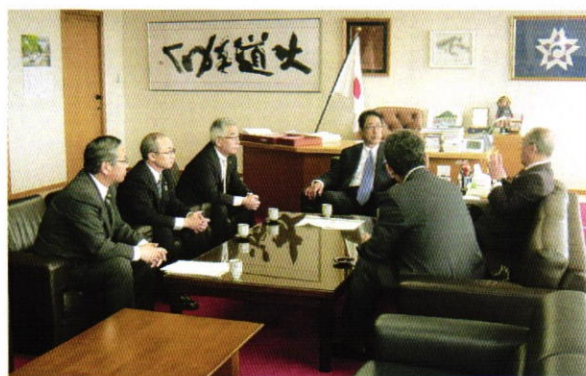
(会報担当者：渡部 二康 委員)