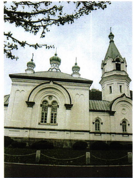
(会報担当者：藤田 正男 委員)