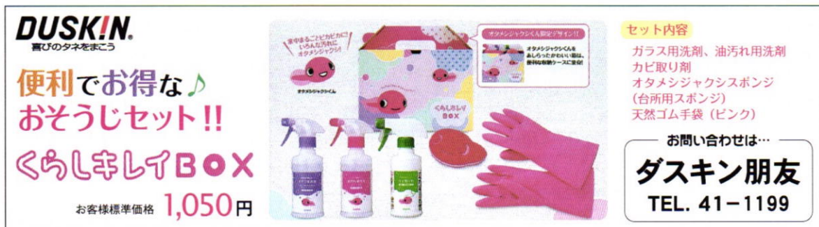
(広告掲載：増山 正 会員)