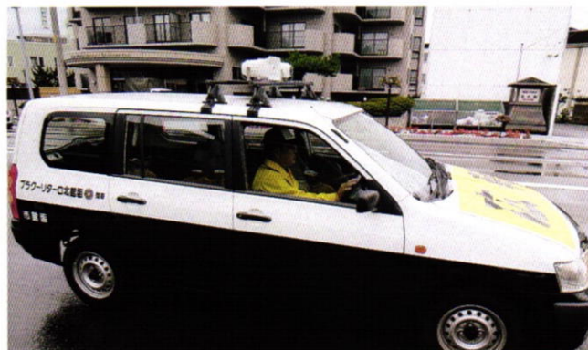
40周年で寄贈した、交通安全車も活躍しています