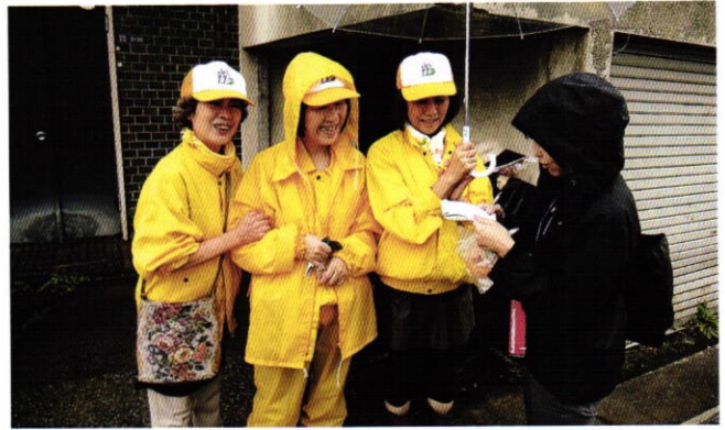
女子会も取材を受けました。記事になりますか…？