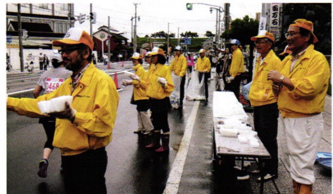
こんなに前に出て、大丈夫ですか？