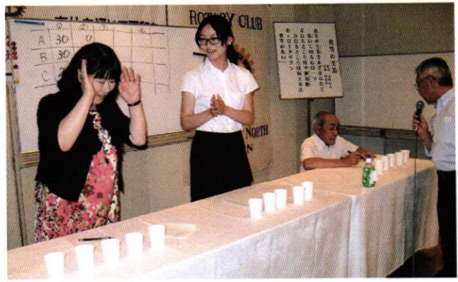
お茶銘柄当てゲーム