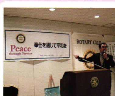
7月25日 夜間例会 「納涼ビールパーティー」

今年度初めての夫人同伴夜間例会において鶴喰会長からご夫人方へ今年度のR1テーマについての詳しい説明がありました。