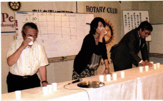
ビール銘柄当てゲーム②