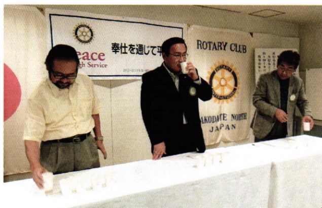
ビール銘柄当てゲーム①