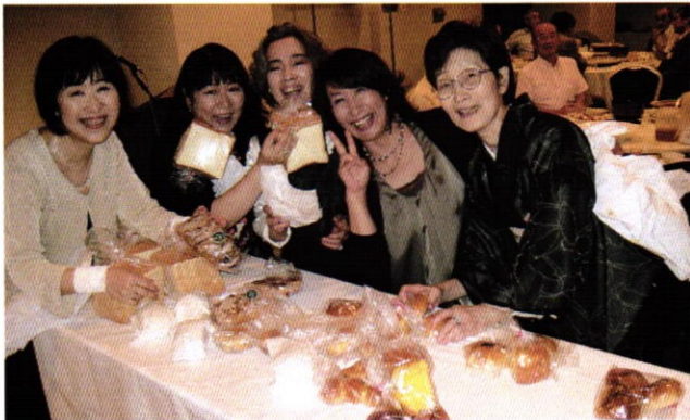
明日の朝食にパンをどうぞ…