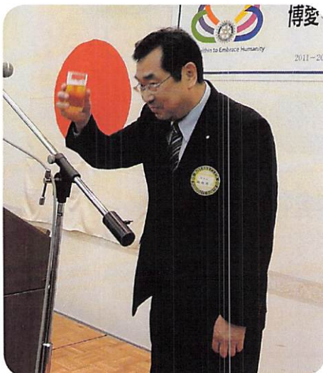
鶴喰エレクトによる乾杯