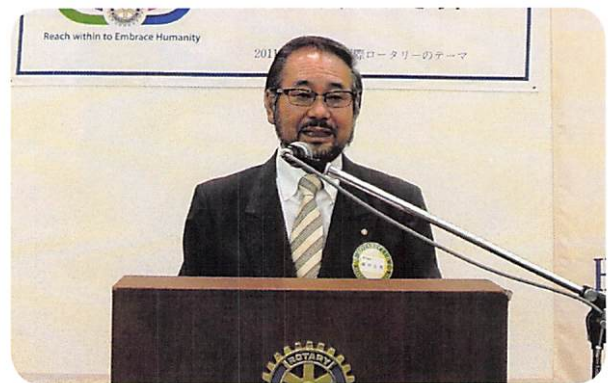
藤田会長 1年を振り返っての挨拶