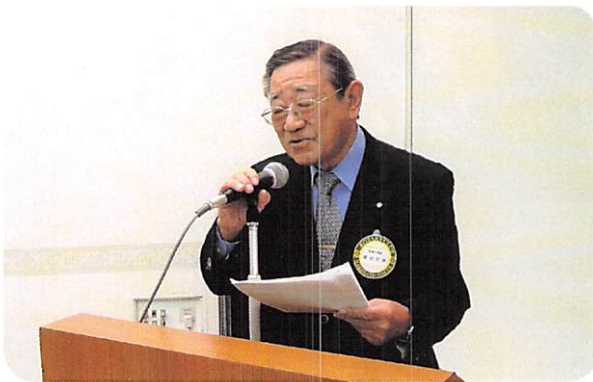
司会を務める増田親睦活動委員長