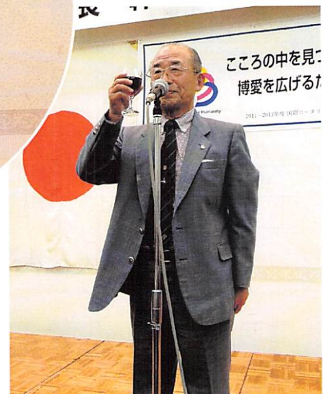
創立50周年会長の森会長ノミニーによる 締め乾杯