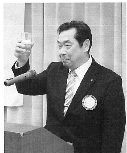
乾杯 鶴喰エレクト

社会奉仕・みなさんのお蔭です。大変ありがとうございます御座いました。年度始めには「家族愛」を主題に施設の子供達を招き、会長の別荘で「一日里親」を努めました。大変有意義な一日でした。又、「洞爺丸慰霊碑清掃」、「ハーフマラソンの支援」も天候に恵まれ、充実した一年でした。