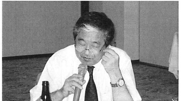
能戸ガバナー補佐を交えて活発な意見交換がされ、有意義なクラブアッセンブリーとなりました。