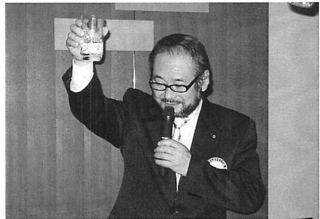
(会報担当者：石橋 輝夫 委員)