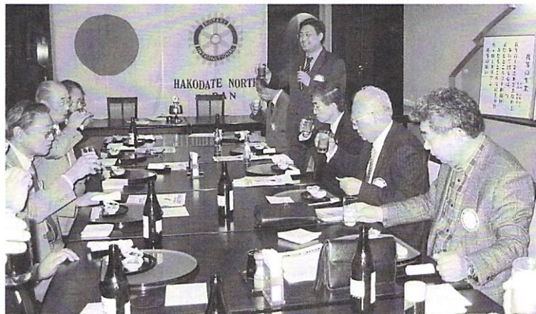
4月27日 夜間例会「クラブアッセンブリー」