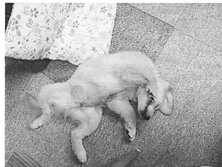
弗田会員の愛犬 ヤマト（生後4、5ヶ月の頃）です。