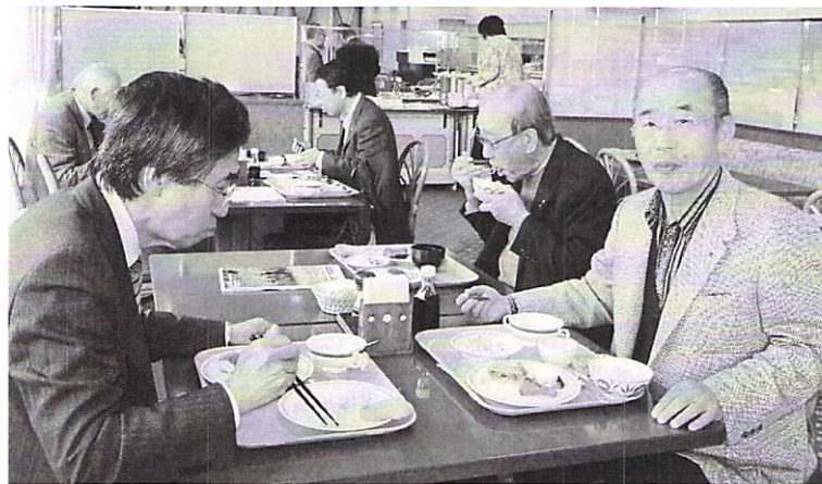
3月2日 早朝例会 於 函館国際ホテル