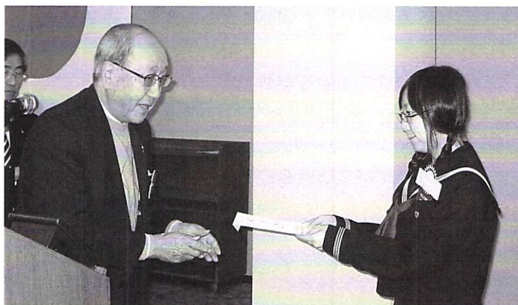
12月1日 クラブ年次総会・クラブ奨学生へ奨学金支給