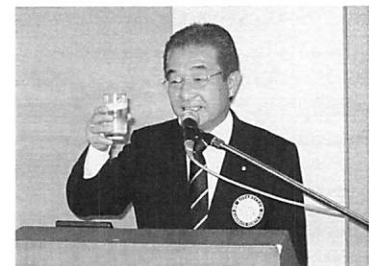
成田会員による乾杯