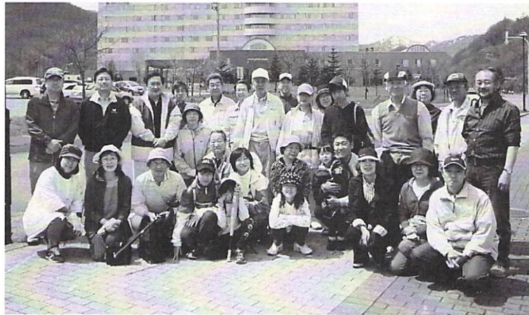
5月16日 移動例会「野外家族会」 於 グリーンピア大沼