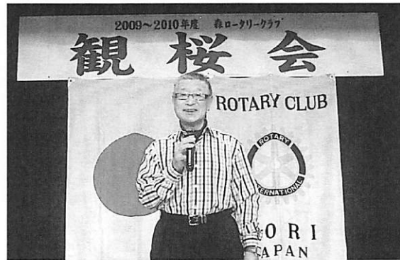
熱唱する中川会員