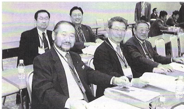
地区協議会にて