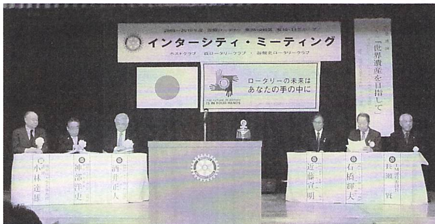
4月3日 09-10年度10・11グループ I.M