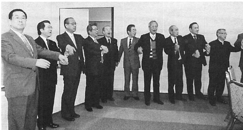
(会報担当者：藪下 義晴 委員)