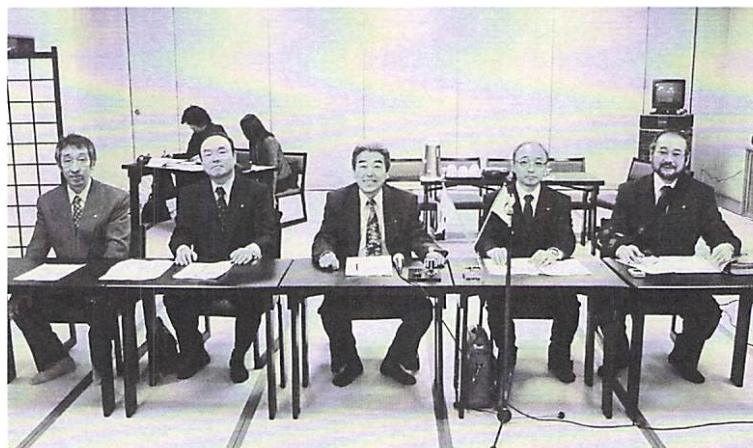
2月17日 七飯RC合同夜間例会 於 大黒屋旅館