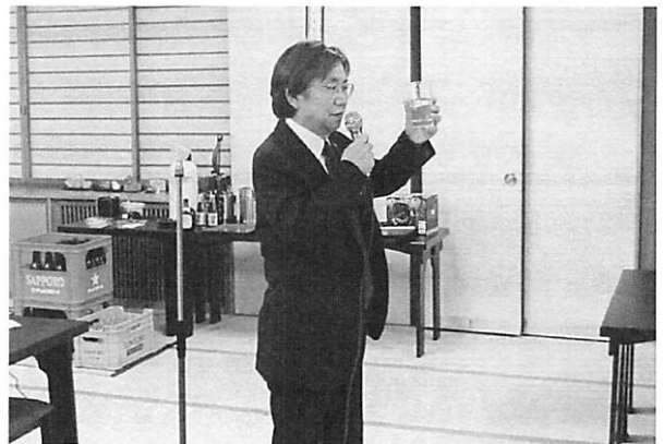
七飯RC上野会員による締め「カンパイ」