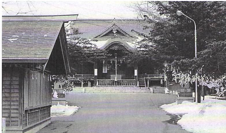
2月10日 移動例会 於 亀田八幡宮