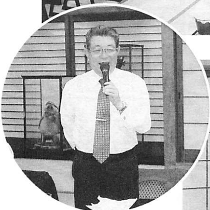
会員の皆様に今年の抱負を話して頂きました。