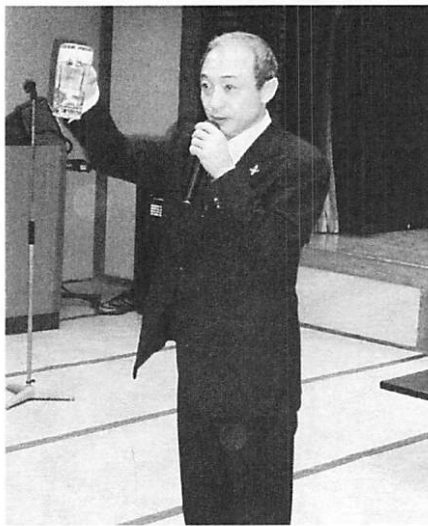
弗田会長による乾杯