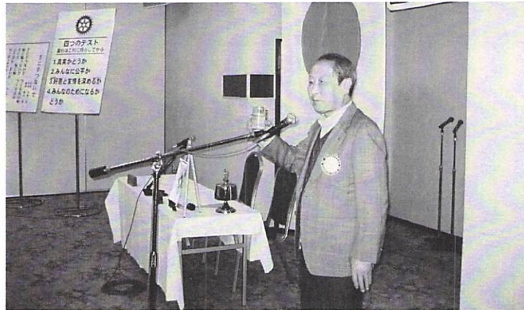
10月21日 夜間例会「秋の親睦家族会」 於 函館国際ホテル