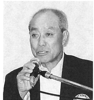
副 S A A 泉 彰 会 員