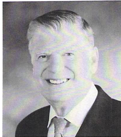
ジョン・ケニー 2009~2010年度国際ロータリー会長