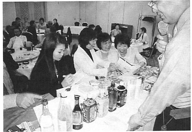
増山親睦活動委員長の司会によるテーブル対抗ゲームで盛り上がりました。