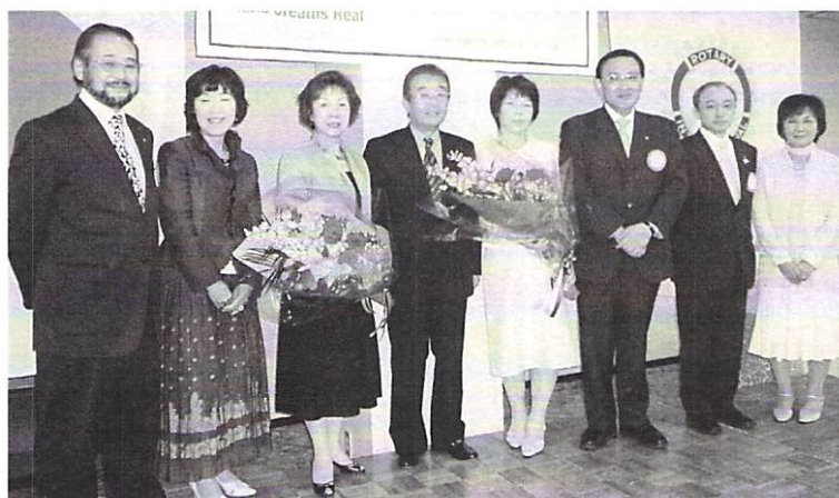
6月10日 夜間例会「会長お疲れ様パーティー」