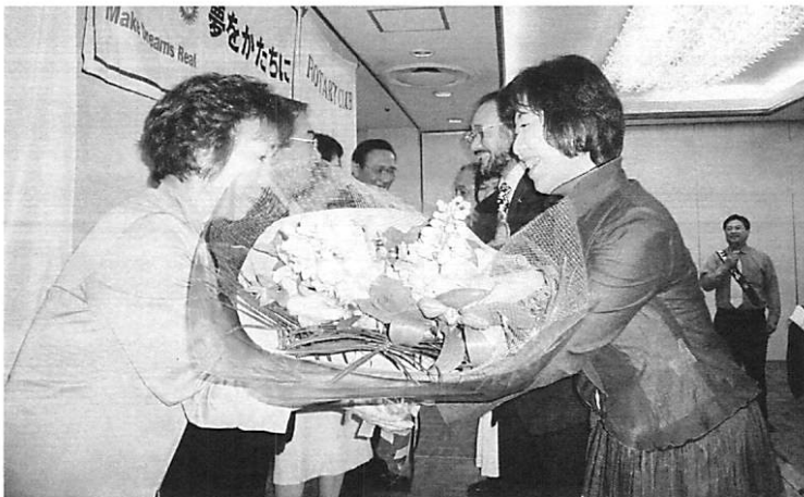
会長・幹事のご夫人へ花束贈呈