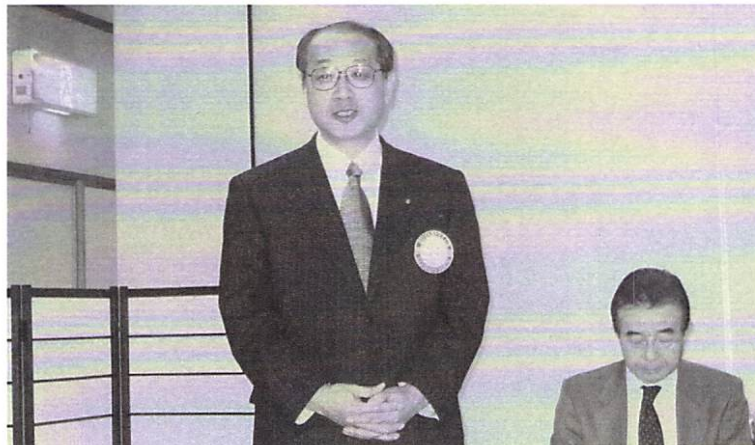
2月18日七飯RC合同例会 於 大黒屋旅館