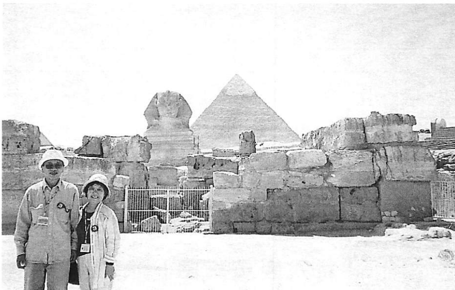
◀ 5/3 エジプト カイロ ピラミッドとスフィンクス