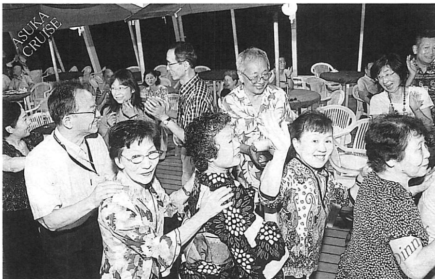
◀ 4/13 船上11階プールサイド アジアンディナー