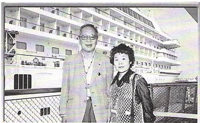
2008年世界一周クルーズ 4月5日~7月16日