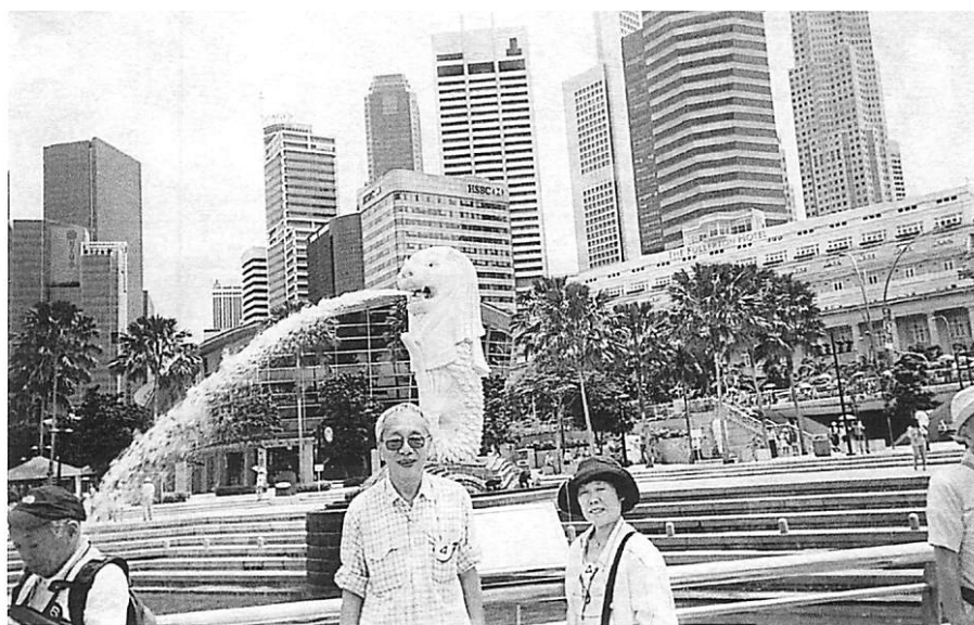
4/14 シンガポール ▶ マーライオン