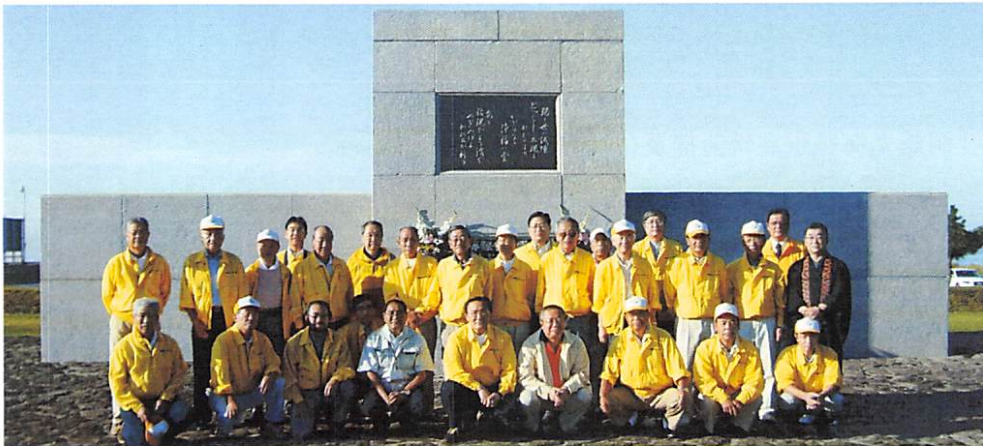
9月10日 早朝例会 洞爺丸海難慰霊碑清掃及び補修完了披露