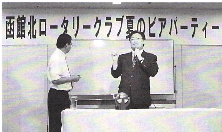
8月20日 夜間例会「夏のビアパーティー」