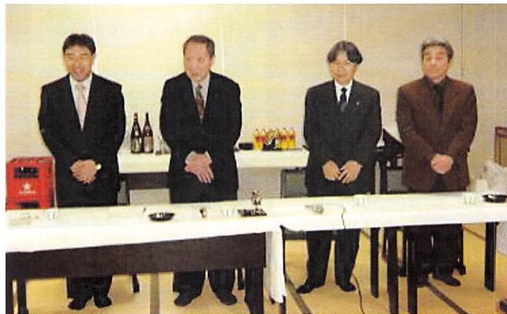
2月20日七飯ロータリークラブ合同移動家族会 於 大黒屋旅館