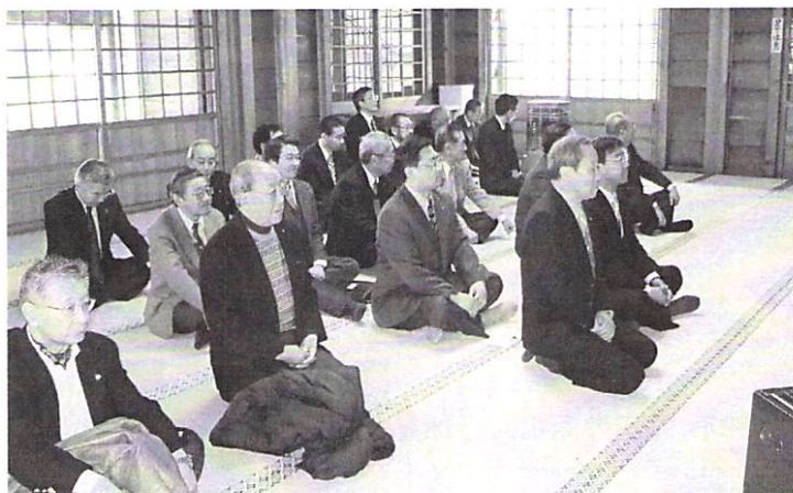
2月6日移動例会 節分 於 亀田八幡宮