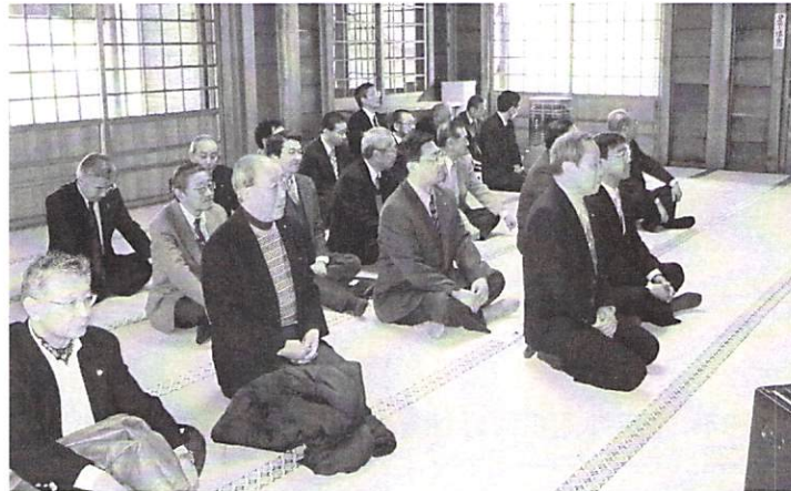
2月6日移動例会 節分 於 亀田八幡宮