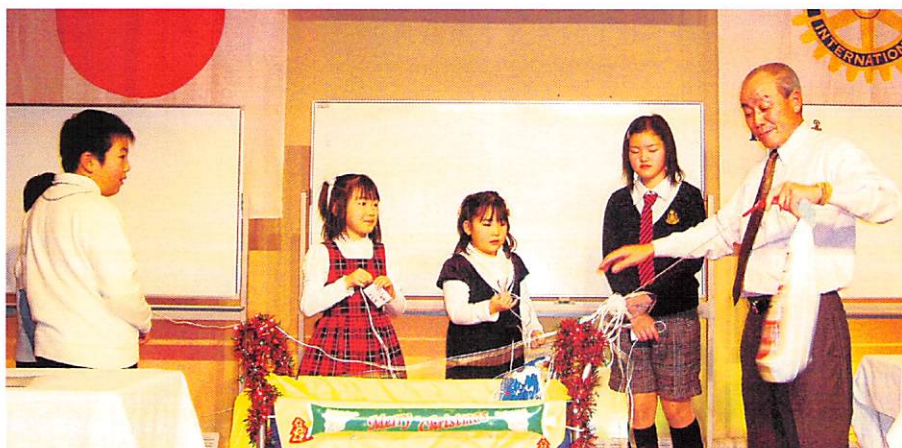
12月19日夜間例会 クリスマス家族会 於 函館国際ホテル