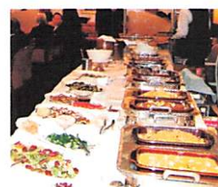
10月24日移動夜間例会 パイキング家族会 於 函館ハーバービューホテル